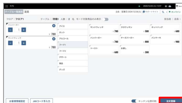
④通常の新規配席時と同様に注文情報を入力し、「注文登録」を押下します。