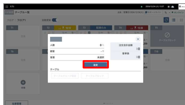
②「注文」を押下します。