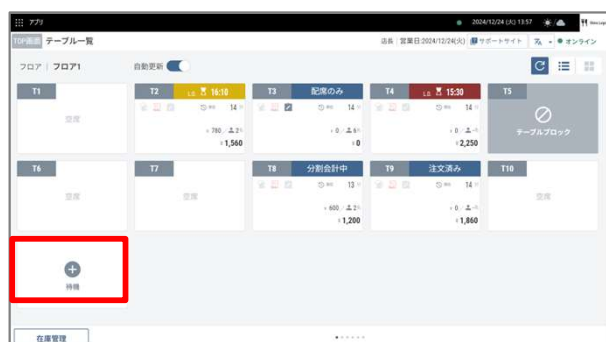
①テーブル一覧の「待機」を押下します。