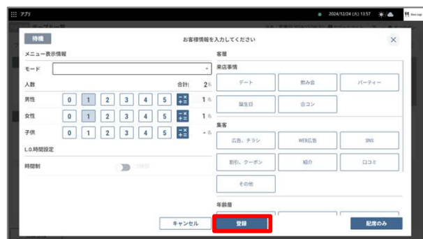
③お客様情報画面にて入力を行い、「登録」を押下します。