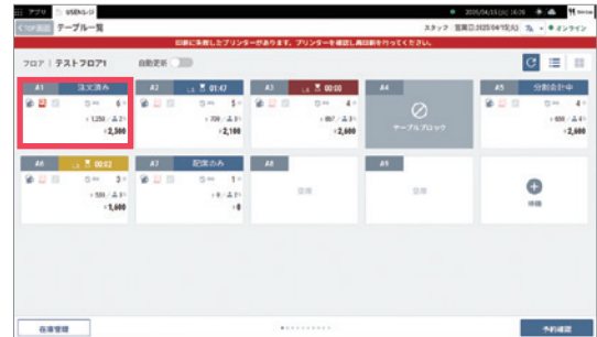
2 テーブル一覧画面が表示されます。印字エラー表示を確認し、再印刷を行うテーブルをタップします。