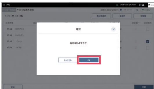
5 [OK]をタップするとプリンタから印刷されます。