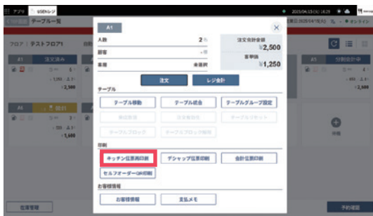
3 [キッチン伝票再印刷]をタップします。