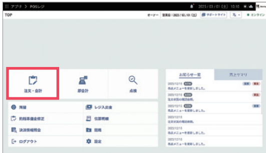
1 TOP画面から[注文・会計]をタップします。