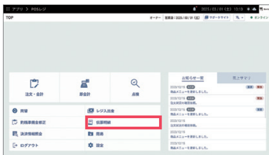
1 TOP画面から【伝票明細】をタップします。