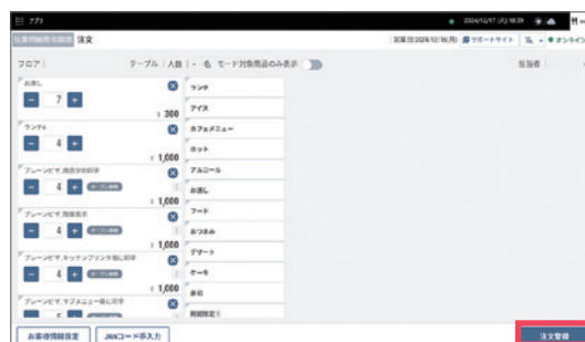
4 注文画面にて商品や数量を変更し、 【注文登録】をタップします。