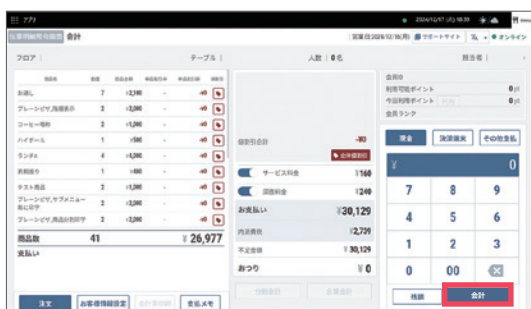
5 会計画面で改めて会計を行うと、 訂正伝票が発行されます。