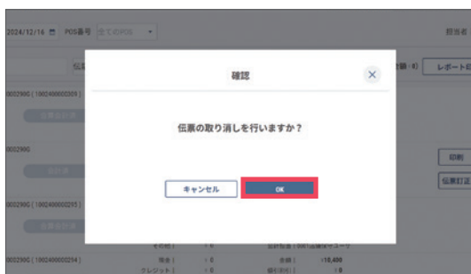
3 【OK】をタップすると利用中の自動釣銭機 またはドロアから払い戻されます。