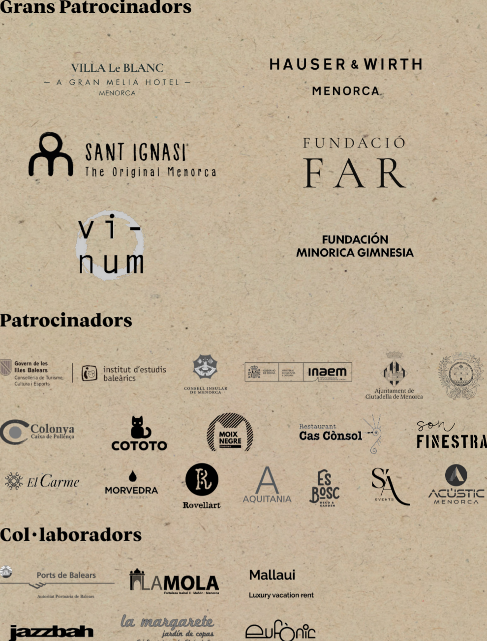
Pedra Viva 2016