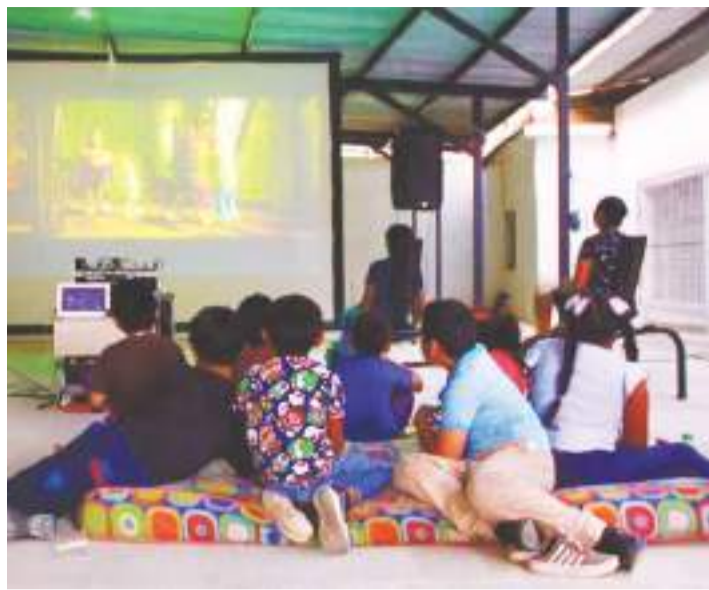
Gobierno Facebook Cultura Colima

La Subsecretaría de Cultura estatal dio a conocer el calendario de actividades de los cursos de verano que realizará en el estado para niñas, niños y adolescentes.