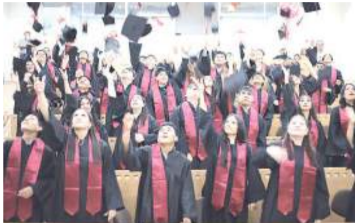
Universidad de Colima

"No todo se debe a este programa, mucho se debe al perfil de las estudiantes que atendemos. Si entendemos cómo funciona el programa durante el semestre, quizá podamos lograr que mujeres que no se visualizan en una carrera STEM empiecen hacerlo", concluyó.