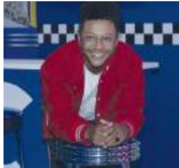
Kalimba enfrenta tres cargos de presunto abuso sexual.

Asimismo, el cantante agradeció las muestras de cariño y apoyo, pero señaló que no puede dar más información al respecto debido a la delicadeza del proceso legal, sin embargo, sus fechas programadas continúan y adelantó que su vida no tiene por qué cambiar.