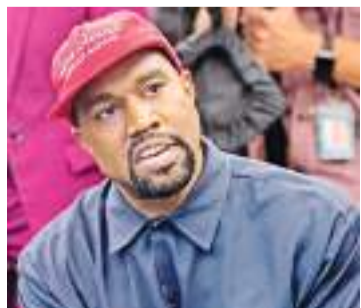
Kanye West fue demandado por un exempleado que lo acusa de racismo, antisemitismo y homofobia.

innumerables ocasiones vio o experimentó personalmente los gritos frenéticos de Kanye a personas negras".