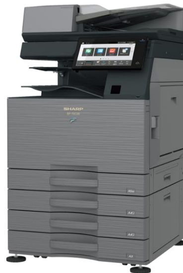
Abb. inkl. optionalem Zubehör