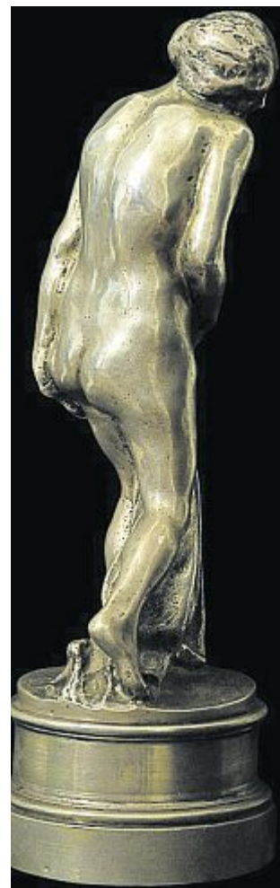
La statuette en argent, haute de 22,5 cm (28 cm avec le socle), évoquerait la relation tourmentée de Rodin avec Camille Claudel.