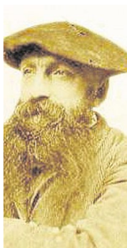
Auguste Rodin (1840-1917).

Les œuvres proposées lors de cette vente seront exposées le samedi 3 décembre et le lundi 5 décembre de 9 h à midi et de 14 h à 18 h, ainsi que le matin de la vente de 9 h à 11 h. ■