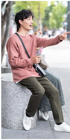
彼女と野外イベントへ