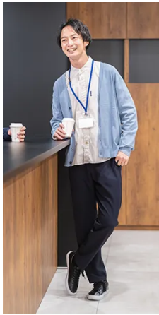
同僚とオフィスで休憩